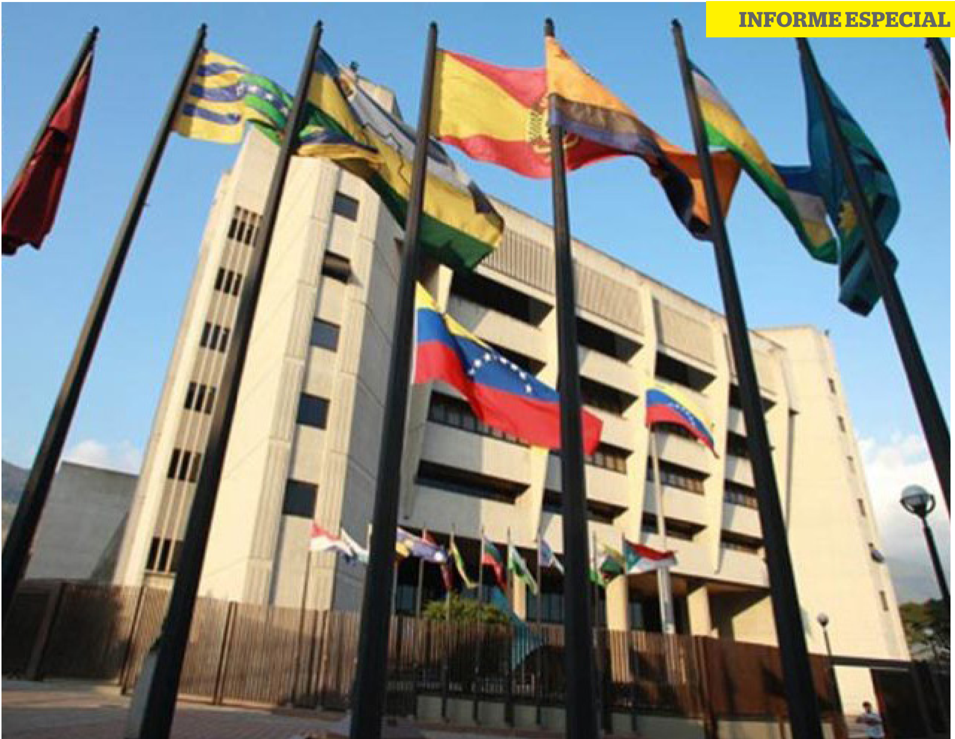
El TSJ ha sido el actor fundamental de la intervención de los partidos en Venezuela.

lar a los principales partidos opositores, de forma de hacer imposible en el futuro la repetición de una victoria opositora similar a la del 2015.